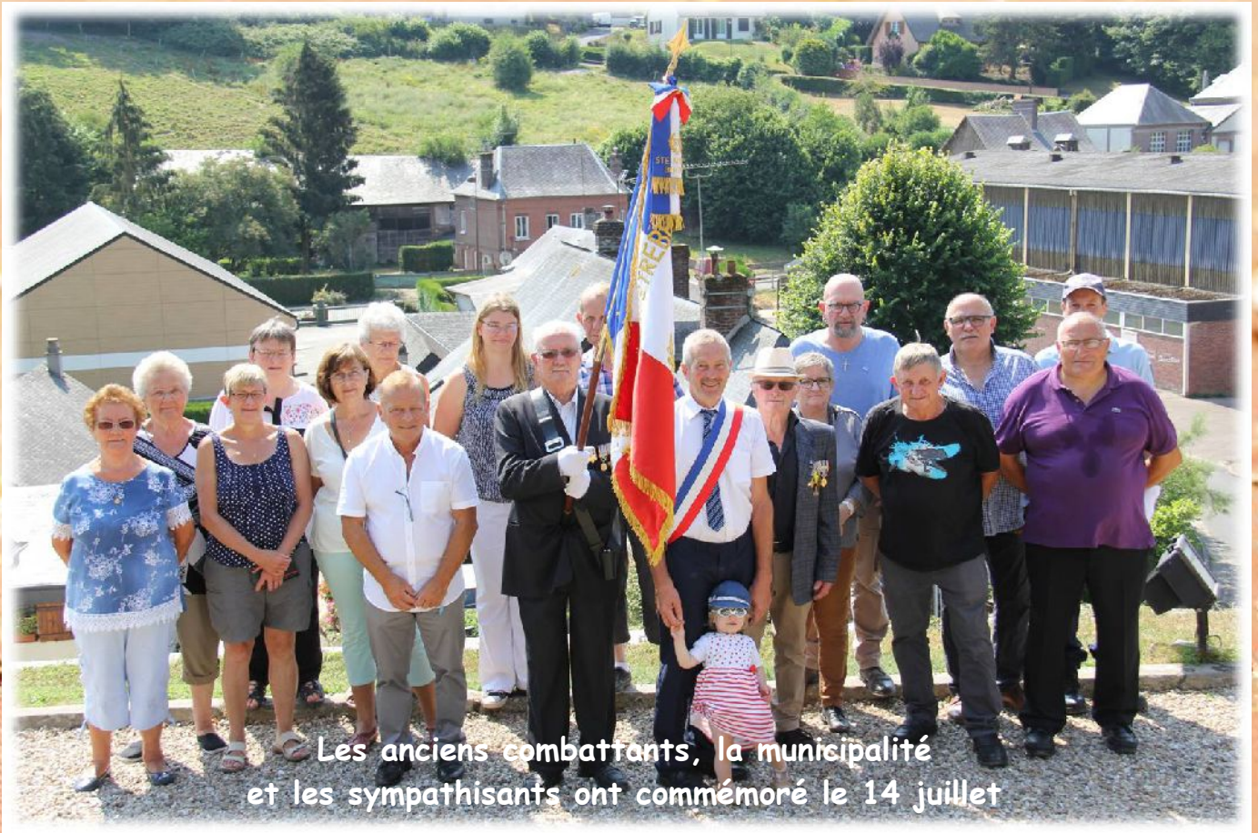
Les anciens combattants, la municipalité et les sympathisants ont commémoré le 14 juillet